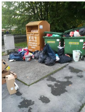
Slika 2. Npropisno odbačen otpad kod spremnika za tekstil

Na području Grada Daruvara postavljena su 22 zelena otoka. Na postojećim lokacijama sakupljaju se papir, plastika, staklo te otpadne baterije, a na 5 lokacija otpadni tekstil i odjeća. Spremnici za tekstil i odjeću premješteni su u reciklažno dvorište kako bi se spriječilo nepravilno odlaganje drugih vrsta otpada što je bio vrlo česti slučaj.