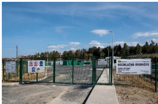
Slika 6 i 7. Reciklažno dvorište u Daruvaru

radionica po mjesnim odborima, te objave na web i Facebook stranicama Grada i komunalnog poduzeća. U 2019. godini za realizaciju projekta izgradnje reciklažnog dvorišta utrošeno je 61.653,98 kn, odnosno 24.866,86 kn iz Proračuna Grada Daruvara, te 96.787,12 iz Kohezijskog fonda.