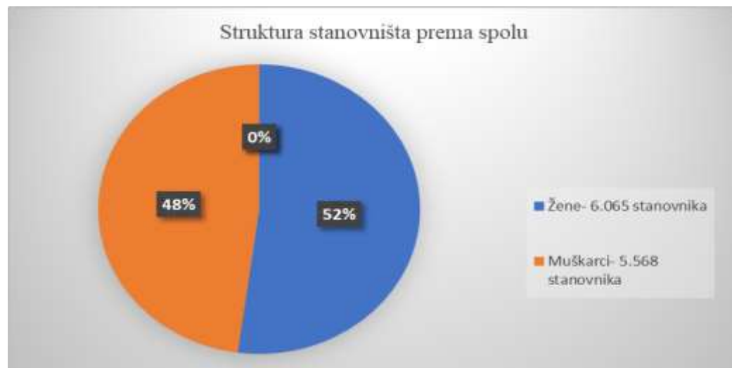
Grafikon3: Podjela stanovništva prema spolnoj strukturi

Kad se razmatra struktura stanovništva prema spolu, u Gradu ali i u cijeloj Županiji zastupljenije su žene. U Gradu je 52% žena, a 48% muškaraca.