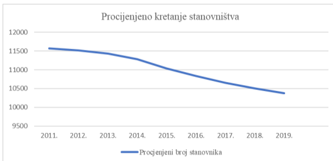
Grafikon 2: Procijenjeno kretanje stanovnika

Prema popisu stanovništva iz 2021. godine, Grad Daruvar ima 10159 stanovnika. Bez okolnih naselja, samo naselje Daruvar ima 7474 stanovnika.